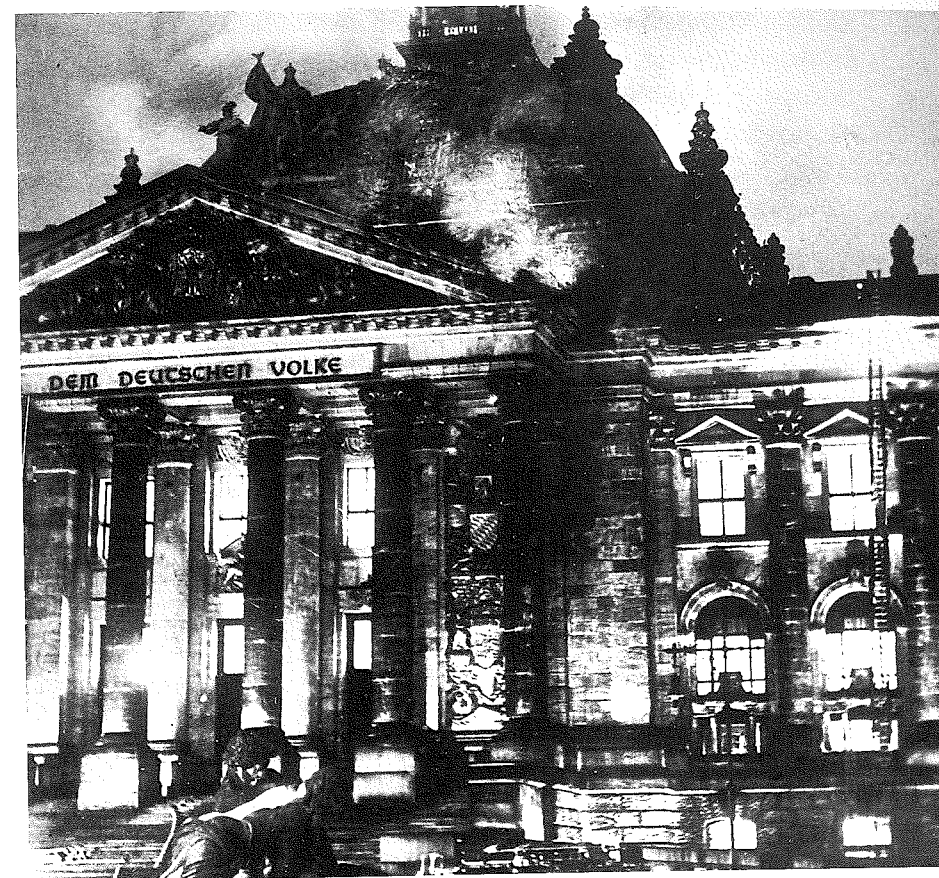
Πυροσβέστες στο φλεγόμενο Ράιχσταγκ.

ούν τη διάδοση του εθνικοσοσιαλισμού αλλά και την έξαρση του γερμανικού εθνικισμού. 74