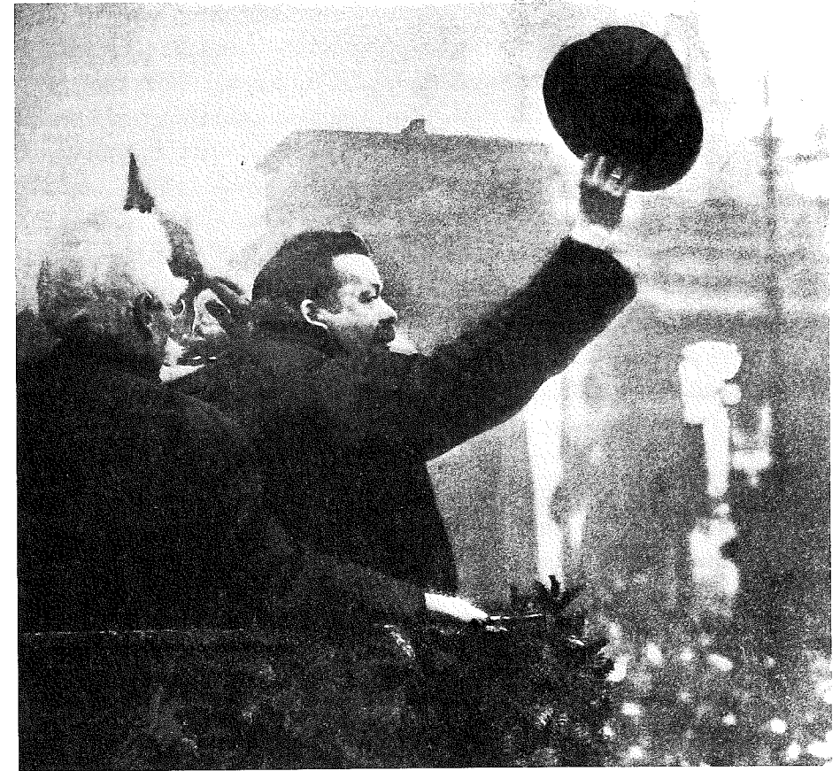
Ο σοσιαλδημοκράτης ηγέτης Φρίντριχ Έμπερτ εκφωνεί λόγο στον ανοιχτό χώρο μπροστά από την Πύλη του Βραδεμβούργου στις 9 Νοεμβρίου 1918, ημέρα πτώσης της Αυτοκρατορίας. Διετέλεσε καγκελάριος το 1918-19 και πρόεδρος της Δημοκρατίας το 1919-1925.